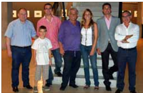
El actor en su visita al Museo de Elda.

Los zapatos «ordinarios, pero cómodísimos» con los que se calzó durante varias temporadas el personaje de Don Pablo en la serie de TVE 'Cuéntame', descansan ya en una de las vitrinas del Museo del Calzado de Elda. Fueron donados el pasado sábado 12 de septiembre por Sancho, que visitó el centro eldense acompañado por su esposa, la escritora y periodista, Reyes Monforte.