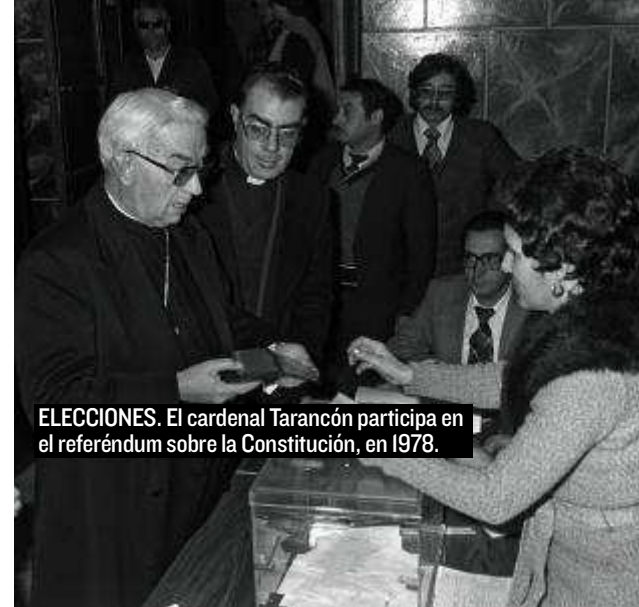
ELECCIONES. El cardenal Tarancón participa en el referéndum sobre la Constitución, en 1978.