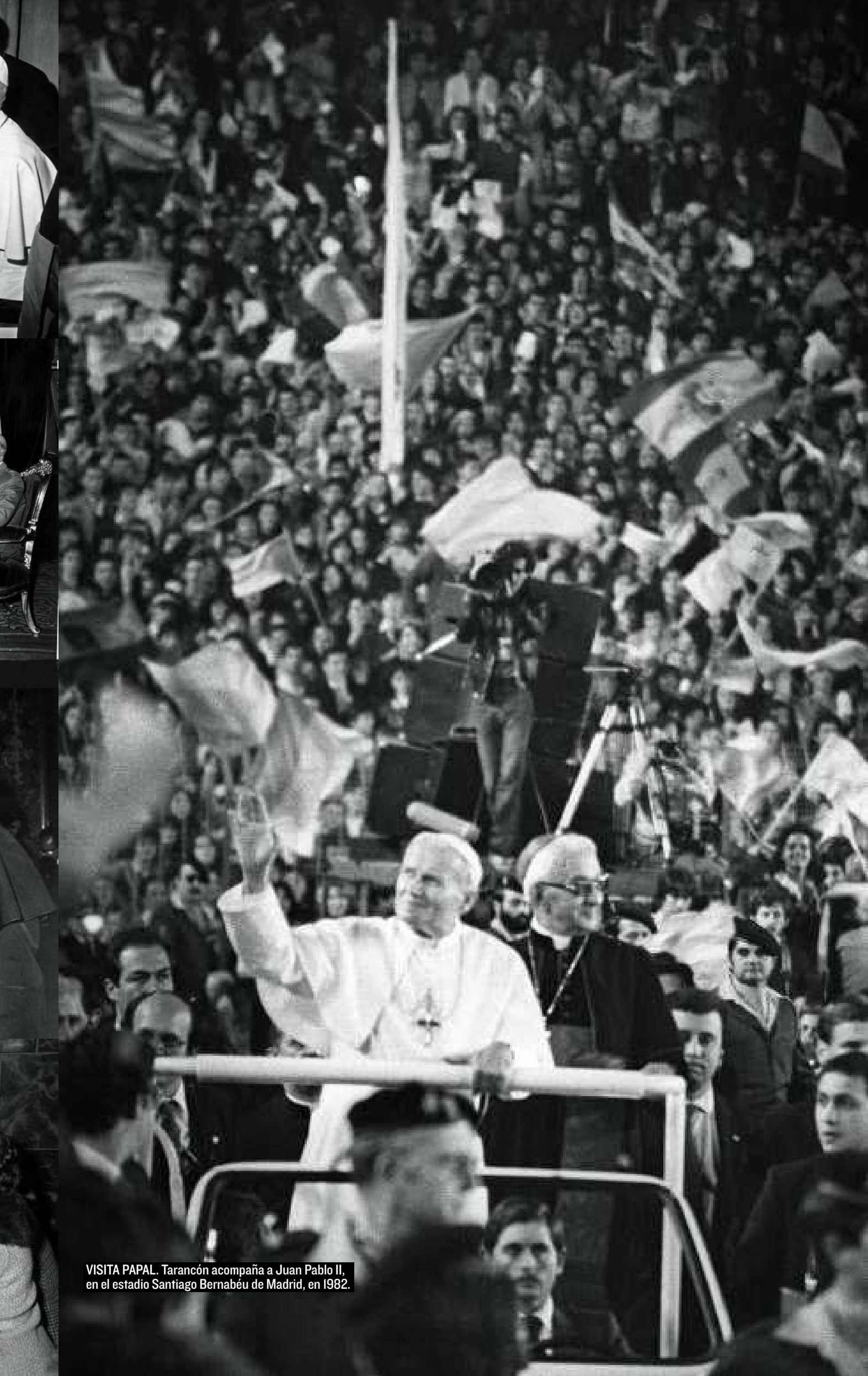
VISITA PAPAL. Tarancón acompaña a Juan Pablo II, en el estadio Santiago Bernabéu de Madrid, en 1982.