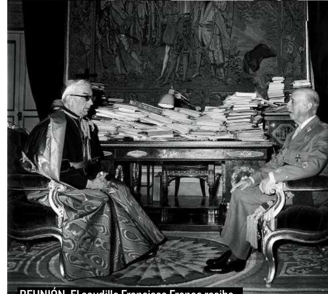
REUNIÓN. El caudillo Francisco Franco recibe al cardenal en el Palacio de El Pardo, en 1969.